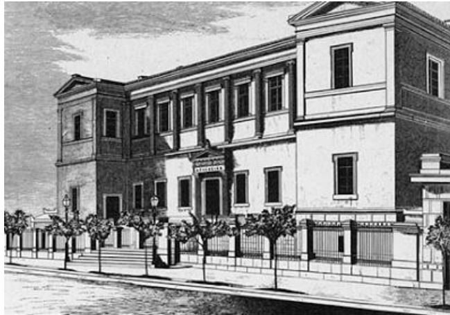
Το Αρσάκειο της Αθήνας