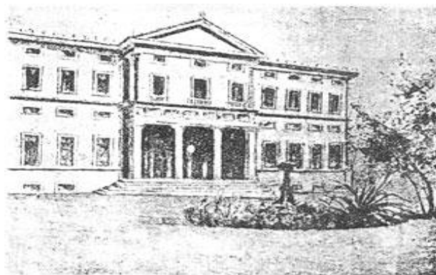
Το Ομήρειον Παρθεναγωγείον

Από τα μέσα του 19 ου αιώνα, πολλοί παιδαγωγοί κατήγγειλαν ότι η Μέση εκπαίδευση αποτελούσε προνόμιο λίγων κοριτσιών που ανήκαν σε μια ορισμένη κοινωνική τάξη και ζούσαν στα μεγάλα αστικά κέντρα, ενώ οι υπόλοιπες μαθήτριες αναγκάζονταν να περιοριστούν στις στοιχειώδεις γνώσεις του δημοτικού σχολείου και πρόβαλαν το αίτημα η μέση εκπαίδευση των κοριτσιών να γενικευτεί και να επεκταθεί σε όλη τη χώρα και σε όλες τις κοινωνικές τάξεις. Ωστόσο, καμία αλλαγή δεν επήλθε ως το 1893 οπότε δημοσιεύτηκε το πρώτο Ωρολόγιο και Αναλυτικό Πρόγραμμα μαθημάτων «των πλήρων Παρθεναγωγείων». Σ' αυτό αποτυπώθηκαν οι αντιλήψεις της εποχής για την εκπαίδευση των κοριτσιών, που όφειλε να είναι προσαρμοσμένη στις «ψυχικές και σωματικές δυνάμεις» και τον «προορισμό» τους. Προς τα τέλη του 19 ου αιώνα με την αλλαγή των κοινωνικών συνθηκών και την αυξανόμενη ζήτηση πανεπιστημιακής εκπαίδευσης από τις γυναίκες, έγιναν προσπάθειες για την βελτίωση και αναβάθμιση της λειτουργίας των Ανώτερων Παρθεναγωγείων, με τη δημιουργία γυμνασιακών τάξεων.