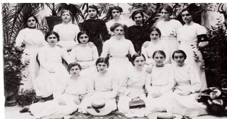
Τα πρώτα αλληλοδιδακτικά σχολεία για μαθήτριες στα χρόνια του Αγώνα και την εποχή των Καποδιστρια