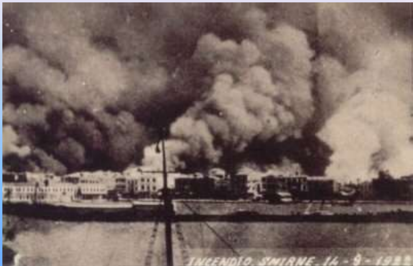
INCENDIO SMIRNE 14-9-1922