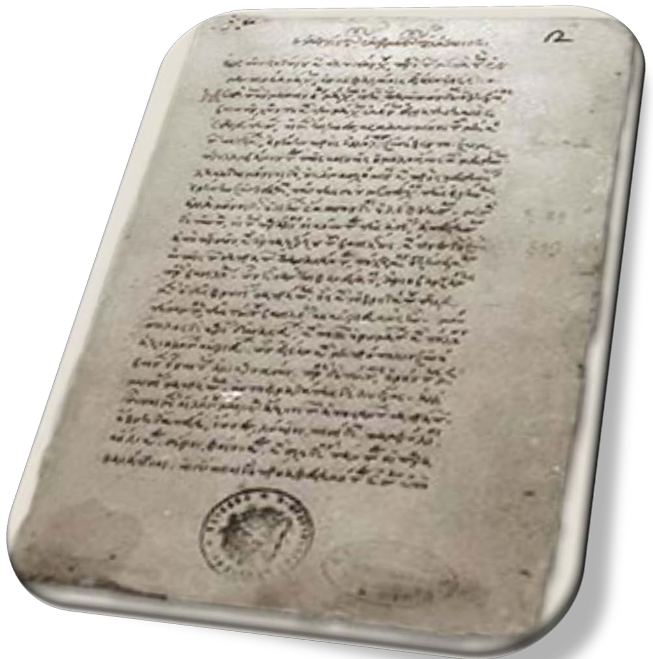
Σελίδα από αυτόγραφο του Γεωργίου Γεμιστού(Βενετία Μαρκανή Βιβλιοθήκη)