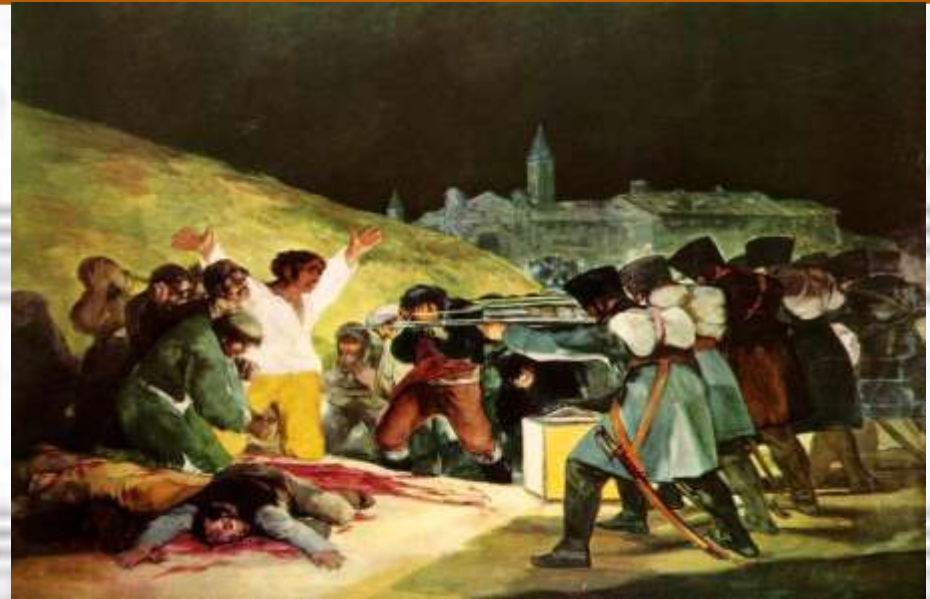
Οι εκτελέσεις της 3ης Μαΐου